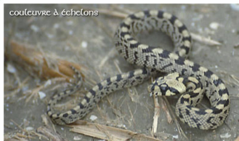
couleuvre à échelons

Elle hiberne longuement, d'octobre jusqu'en mars ou avril. La reproduction s'effectue en avril ou mai parfois jusqu'en juin ; la ponte a lieu en juin ou juillet. Les œufs sont blanchâtres, le nombre varie de 5 à 10 œufs et peut monter jusqu'à 20, ils sont déposés en terre ou dans un trou. L'incubation dure 2 à 3 mois, les couleuvreaux mesurent environ 20 cm et se nourrissent de grillons, de criquets et de sauterelles.