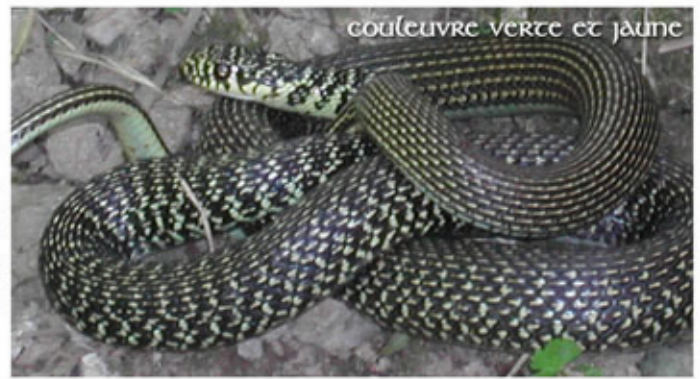
couleuvre verte et jaune

À côté de ces sympathiques lézards et de ces terrifiants serpents, les eaux cristallines, de l'Orb notamment, hébergent un autre reptile, véritable fossile vivant, la cistude d'Europe, seule tortue aquatique endémique des rivières méditerranéennes, mise à mal depuis de nombreuses années par l'introduction d'une belle et vorace américaine, la tortue de Floride.