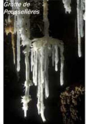
Gratte de Pousselières