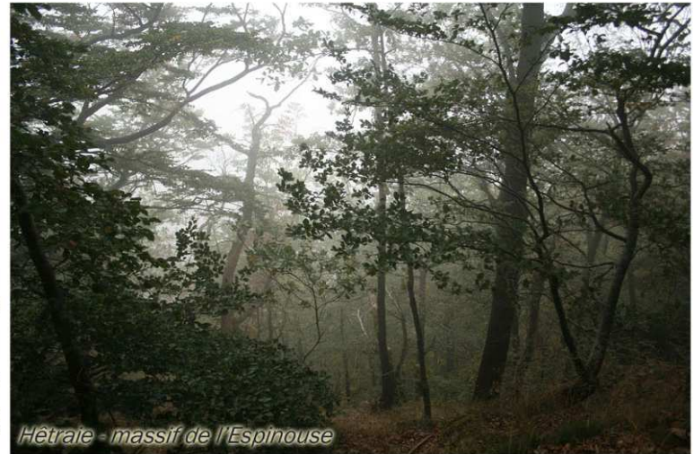
Hêtraie - massif de l'Espinouse

Envahissant sur son passage prairies et pâtures laissées à l'abandon, la forêt entraîne la fermeture des milieux qui engendre tout un tas de complications tant écologiques (appauvrissement et diminution de la biodiversité faunistique et floristique) qu'économiques.