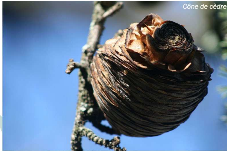
Cône de cèdre