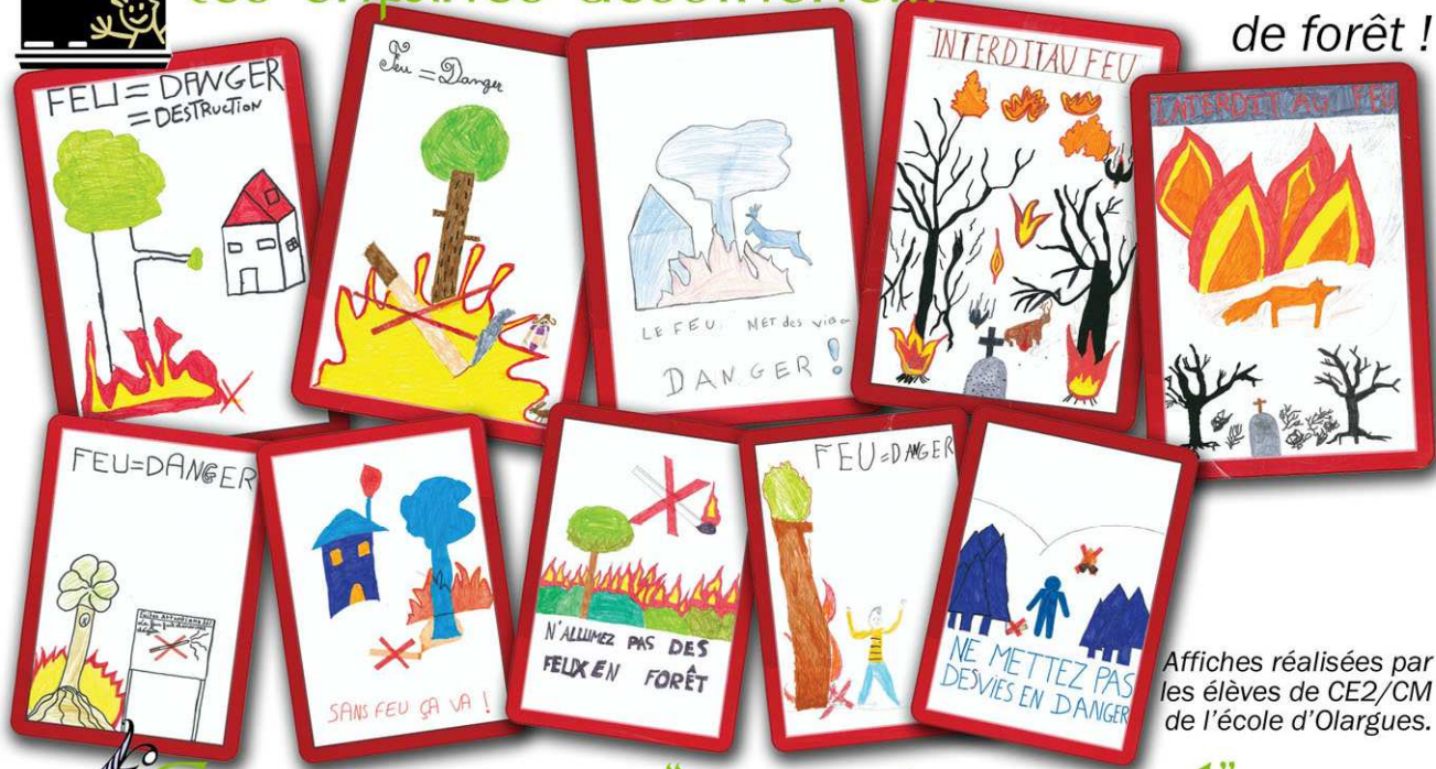
Affiches réalisées par les élèves de CE2/CM de l'école d'Olargues.

les enfants dessinent... contre les incendies de forêt !