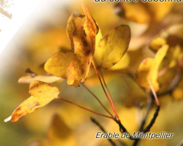
Erable de Montpellier