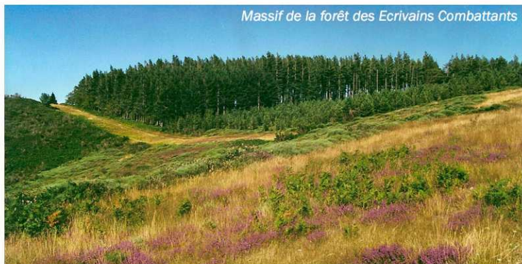
Massif de la forêt des Ecrivains Combattants

L'originalité et l'exemplarité de sa constitution valent à la forêt des Ecrivains Combattants une grande renommée, un fort attachement des populations, et en font aujourd'hui un élément important dans le développement local orienté vers l'écotourisme.